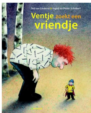
Groep 1 en 2