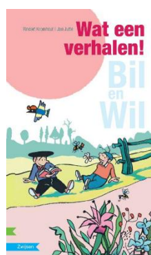
Groep 3 en 4